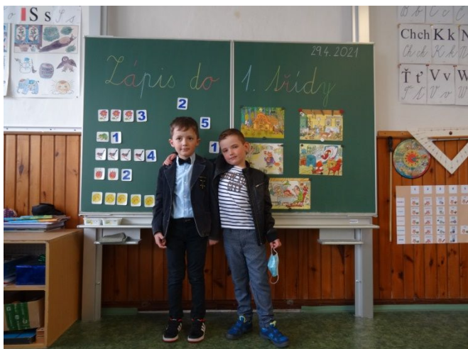
zápis do 1. ročníku