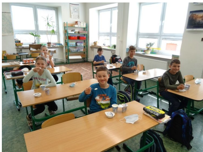
ochutnávka mléčných výrobků