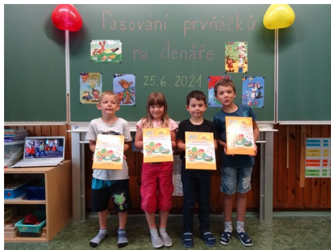
pasování prvňáčků na čtenáře