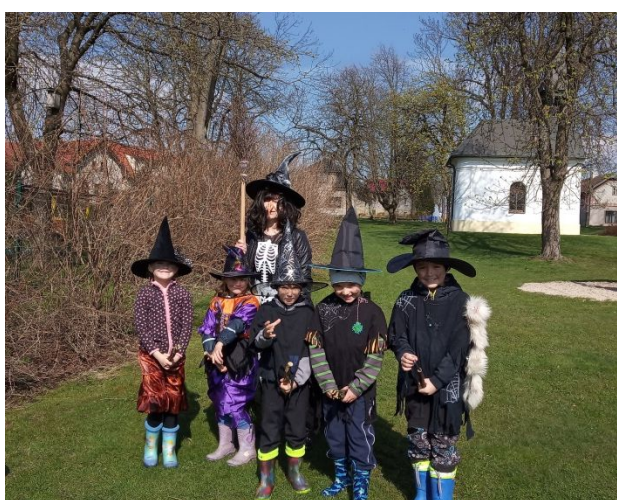
čarodějnice ve školce