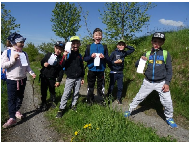
Den dětí – vycházka do Malé Losenice