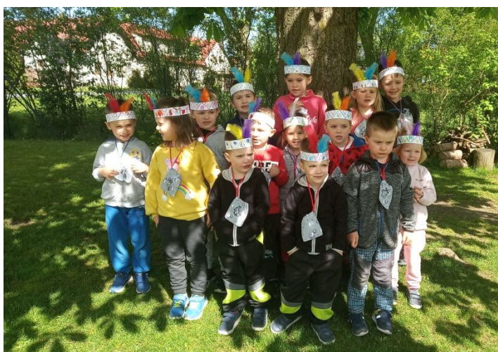
dětský indiánský den v MŠ

Přejeme všem krásné a zasloužené prázdniny.