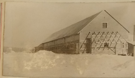
Pohled od silnice