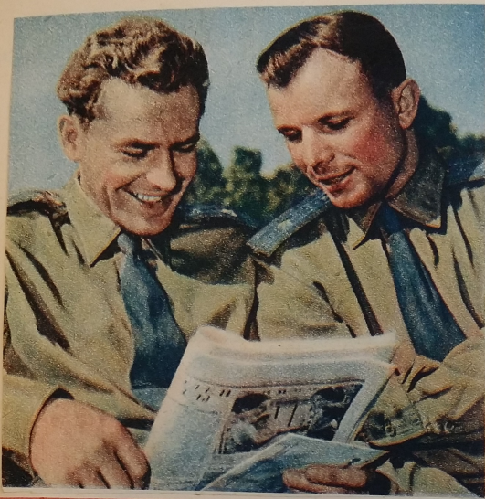
Vpravo: Gagarin, vlevo: Titov. Majori - kosmonauti: Jurij Gagarin, Gherman Titov nar. 1934 nar. 1935

K 28. 2. bylo v naší republice provedeno sčítání lidí a lidí. V naší obci tento den bylo 359 lidí, v republice 13,750 000.