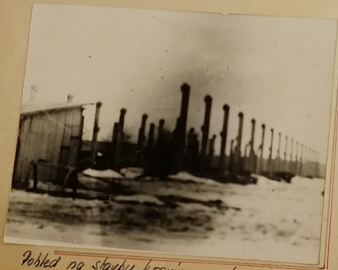
Pohled na stavbu krávnice v únoru 1961

Druhou velkou stavbou v naší obci byla stavba nového krávnice za vsí, směrem k Radostá- nu. Krávnice jest se skladovacími prostory. Hodno- tu díla bude se rovnat asi 700 000 Kčs. Stavěno jest na 106 ks krav. Jest to stavba moderní- ná. Montáž prováděl nřr. p. Montáže - Brno.