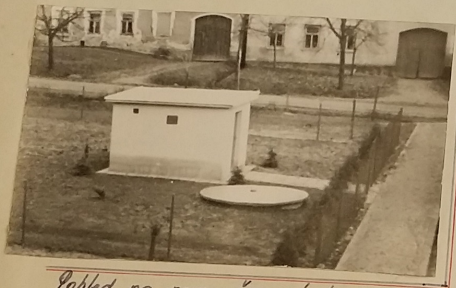
Pohled na novou čerpači stánci před školou.

v roce 1962 budován vodojem - to je asi 600 m. Tímto byla vytvořena na obecním vodovodu hodnota díla asi 97 000 Kčs.