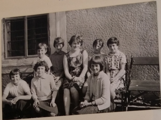
Z výletu na Perštejno: