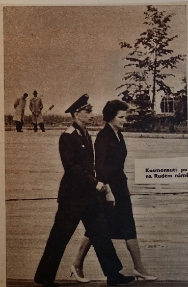
Kosmonauti po přeletu do Moskvy a při slavnostní manifestaci na Rudém náměstí

V srpnu navštívila Československo. Byla bouřlivě přivítána Pražany.