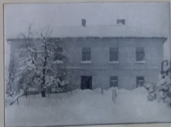
Škola v únoru 1970.

Zimní prázdniny byly o 14 dní prodlou- ženy a pololetní prázdniny posunutý na 13. úno- ra.