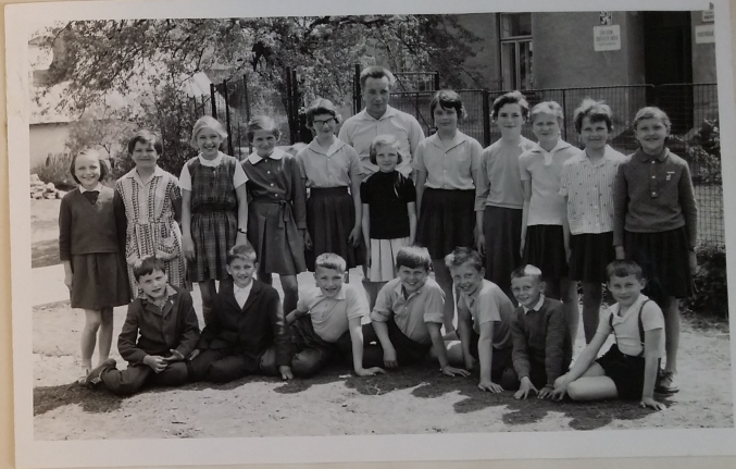
II. tř. - šk. rok 1963-64.