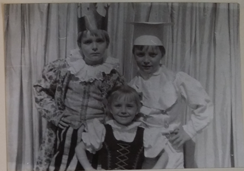
Z divadla „Doktor Honza“.

V březnu byly uspořádány lyžařské závody dětí, které pořádáme již po 5. a kší se velké oblíbené dětí. Vítězi v tomto ročníku byli žáci: