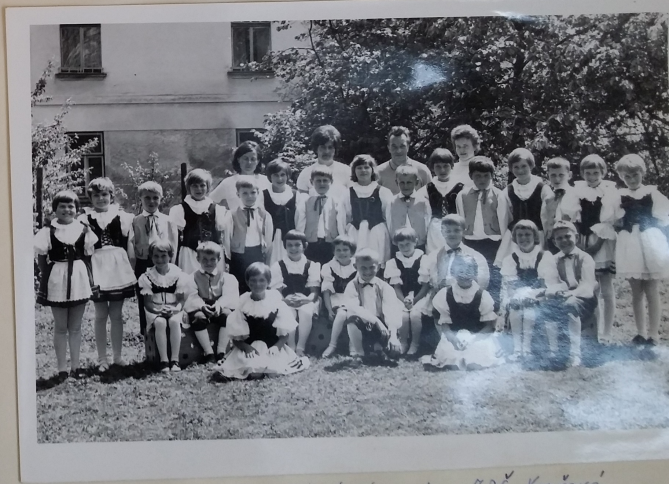
Horácký soubor ZDŠ Vepřová. - 1969 -