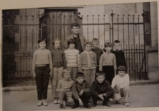
Šk. výlet: Děti školy z Vahna:

Kromě nové střechy, kterou dokončil OSP v červenci byly na škole provedeny ještě tyto opravy: