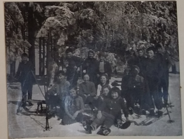
Zimní sporty ve šk. r. 1963-64.