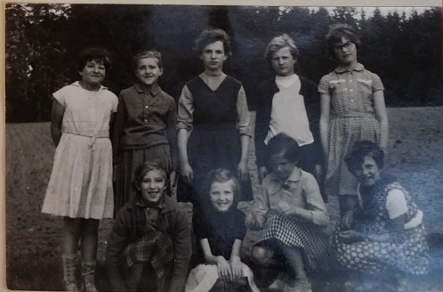
Děvčata III. tř. post. roč.

O hlavních prázdninách jsou vymalo- vány učebny a chodby.