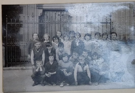
Šk. výlet : Žáci školy z Koprůvce