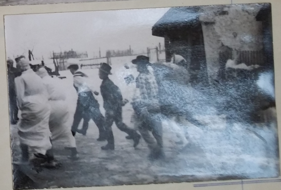
Záběry z dětského karnevalu - průvodu mask.