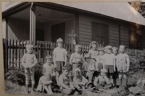
Žáci I. tř.