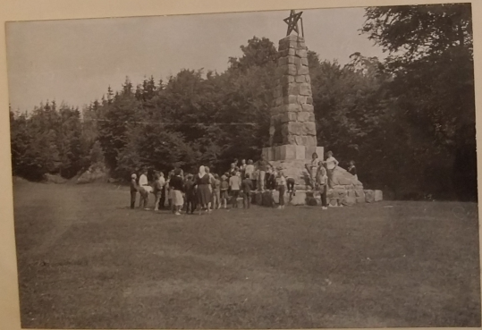
Snímek ze šk. výletu. U pomníku padlých na Zubštejově.