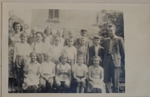
II. tř. - 4. a 5. post. roč.

Školní rok byl ukončen v sobotu 27. června.