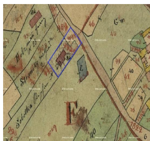
Domek čp. 61 ve Vepřově