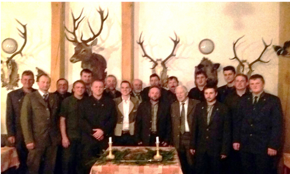
členové MS Vepřová

Myslivce většinou potkáme při procházce v lese, a tak by se zdálo, že je to práce romantická a pohodová. Málokdo si však uvědomuje, že myslivci se v přírodě zvěři věnují celoročně. Je to nejen koníček nebo zábava, ale i jistá služba veřejnosti, pro někoho možná i životní styl. Myslivci pečují o zvěř a tím o národní bohatství, v době nouze se o ni starají a přikrmují ji, na druhé straně je nezbytné zvěř regulovat a udržovat její stavy v únosné míře. Myslivost je nejenom radost, ale především práce a starost.